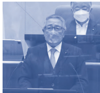
▲自民党を代表し、代表質疑に登壇

今回のレポートは、自由民主党を代表し代表質疑に登壇した際の質問と答弁の一部を記載させていただきました。是非、一読いただき皆様の仙台市政へのご意見を頂戴したいと考えております。